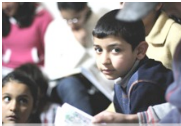
Søndagsskole i Kavartsi

til Banica for å holde møte der på kvelden. Banica har en spesiell historie, og har tradisjonelt sett vært helt stengt for evangeliet. Kristne i landet har flere historier om predikanter som bokstavelig